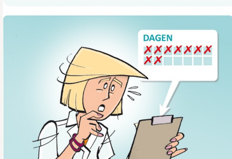
Het blijkt dat Bart Amiodaron te lang in een te hoge dosering heeft gekregen. Op het medicatieoverzicht en op de toedienlijst was niet te zien dat de dosering gewijzigd moest worden.